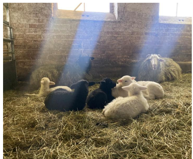
Abbildung 5: Neue Lämmer in der Landschaftspflegeherde