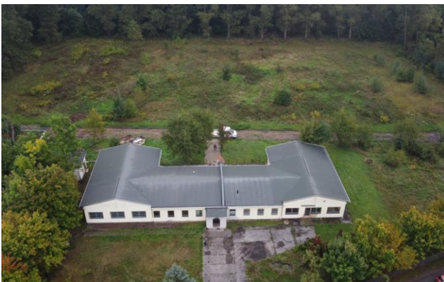
Abbildung 6: Neues Domizil der Natura 2000-Station "Gotha/ Ilm-Kreis" in Ichttershausen