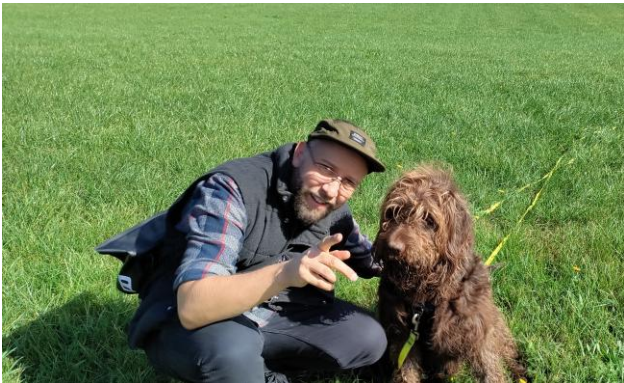
Abbildung 10: Georg Thein