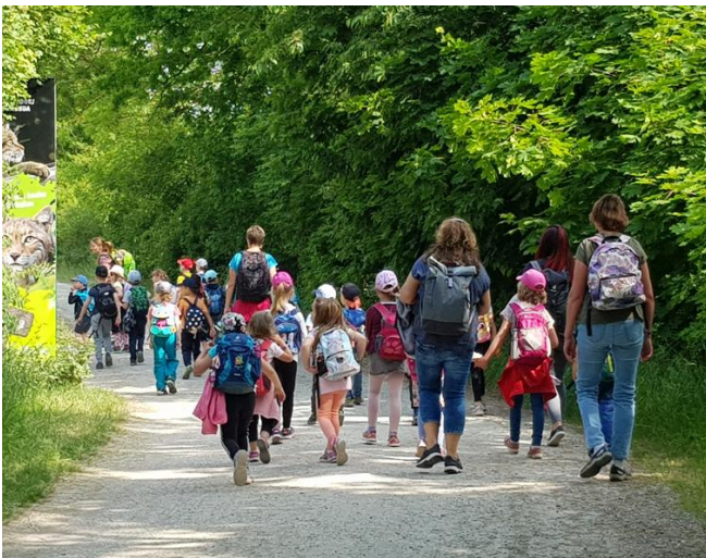
Abbildung 11: Umweltbildung

Die Natura 2000-Station Unstrut-Hainich/Eichsfeld bietet im Rahmen ihres 10-jährigen Bestehens Mitte Mai drei Wanderungen im Stationsgebiet an. Die Referent*innen geben Einblicke in die Naturschätze am Rande des Nationalparks Hainich, an der Unstrut und im Eichsfeld. Während der Wanderungen informieren die Stationsmitarbeitenden über aktuelle Naturschutzprojekte und die Stationsarbeit. Ausführliche Informationen zu den Wanderungen und Anmeldung unter https://nat-2000.de/veranstaltungen .