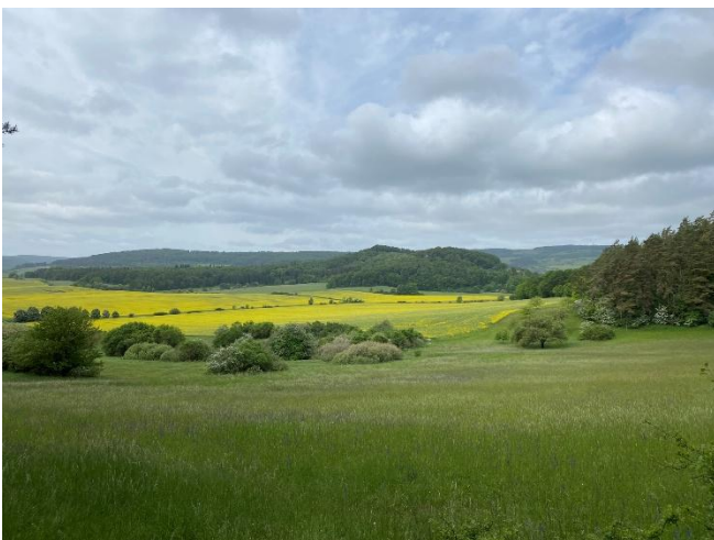
Abbildung 2: Landschaftsaufnahme

(Text: Natura 2000-Station Südharz/Kyffhäuser)