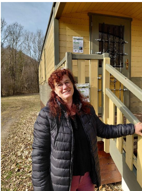
Abbildung 8: Heike Schröter © privat