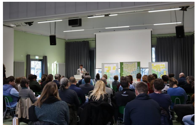
Abbildung 1: Workshop "Synergien GUV und Natura 2000"