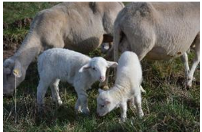
Abbildung 7: Drei Tage alte Lämmer der neuen Landschaftspflegeherde der Natura 2000-Station Unstrut-Hainich/Eichsfeld