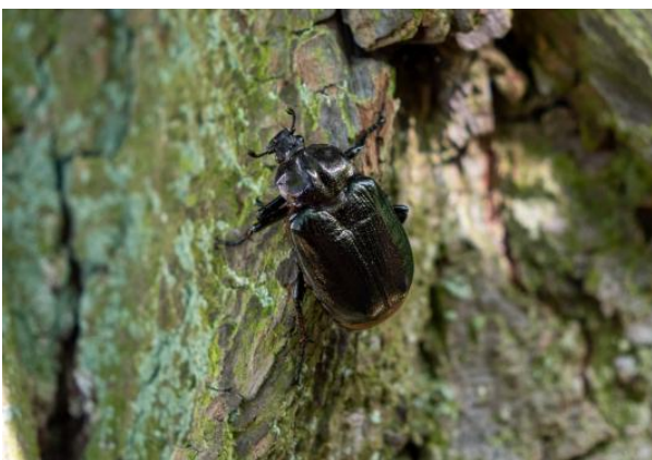
Abbildung 4: Artennachweis Eremit Lindenallee Ichstedt